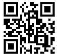
動画 (YouTube) QR コード