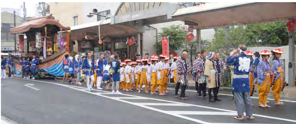
祇園祭 お舟の天王山車

本構想で示した6つの「関連文化財群」と9つの「歴史文化保存活用区域」は、本市の地域計画においても大きな役割を担うものとして位置付ける。また、地域計画に示す文化財の保存・活用に関する措置は、本構想に示す各方針に即すものとし、計画期間中に行う事業や関係法令上の措置など具体的な内容について、実施時期を可能な限り明確にした上で記載する。都市計画行政や景観行政、農林行政、観光行政、地域自治組織等の関連する行政部局との連携のもと、市民や活動団体等との協働体制を構築して、地域に根ざした保存・活用の取り組みを推進する。