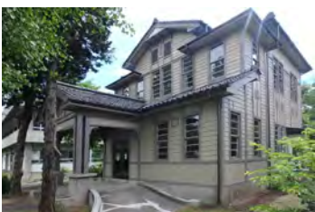
信大繊維学部 旧千曲会館

江戸時代後期から、上田市では蚕種・養蚕業が盛んで、明治時代になると製糸業も栄え、蚕糸業の一大都市として国内でも有数の規模を誇る。そうしたなかで国内唯一の国立蚕糸専門学校である上田蚕糸専門学校が設立されるなど教育や蚕業研究の拠点が整備された。蚕都上田の繁栄は、上田自由大学や農民美術運動など、現在の生涯学習の基礎となる。