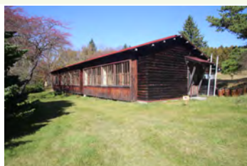
筑波大学 菅平実験施設

別所温泉や丸子温泉郷など、市内には歴史ある温泉が多くある。温泉地は、古くは外湯の湯治場として利用され、近代には内湯化が進み、鉄道や道路などの整備とともに温泉リゾート地や保養地として、多くの観光客や文化人を招いてきた。また、菅平高原や美ヶ原高原では、冷涼な気候を活かして、スポーツ合宿や、研究所、避暑地として発展している。