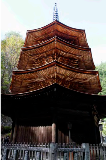
安楽寺八角三重塔

6つの関連文化財群をふまえ、中央、西部、城南、神科豊殿、塩田、川西、丸子、真田、武石の地域別に文化財の保存と活用の方向性を示す。