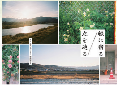
写真:藤田貴大 メインビジュアル:六月