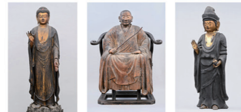
左:阿弥陀如来立像 芳泉寺(上田市指定文化財) 中央:惟徳和尚坐像 安楽寺(国指定重要文化財) 右:薬師如来立像 神畑薬師堂

7/12(金)～9/8(日) 特撮のDNA in 信州上田展 特撮映画の70年 —それは『ゴジラ』から始まった—