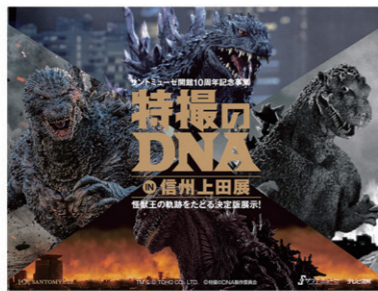
TM & © TOHO CO.,LTD. ©特撮のDNA製作委員会

7/12(金)～9/8(日) 特撮のDNA in 信州上田展 特撮映画の70年 —それは『ゴジラ』から始まった—