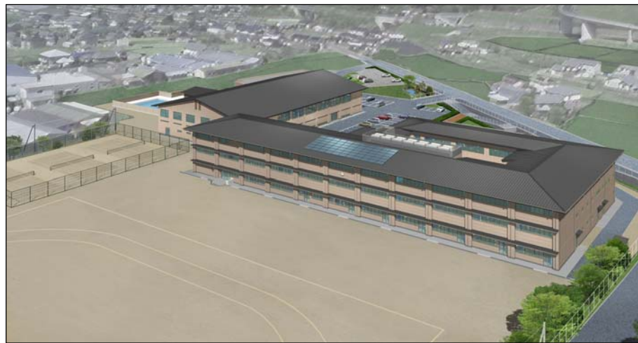
南東からの鳥観図