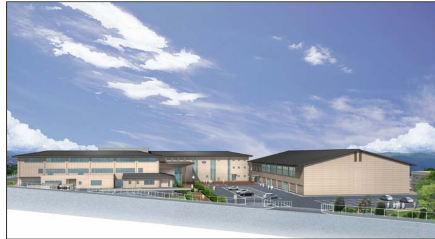
屋内運動場北側からの外観