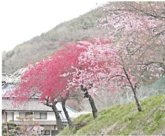
③トキノスコース (0.7km) 余里では、普段の生活を忘れゆっくりと花桃を眺められます。