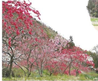
②中央農道コース (1.2km) 新緑の中から見下ろす花桃は、また違った景色が楽しめます。