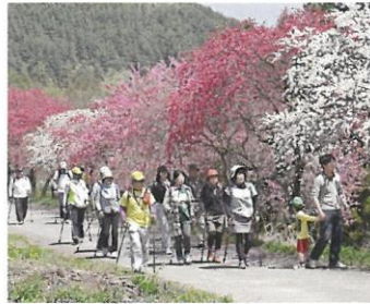
④宮前コース (0.6km) 赤白の花桃が咲き乱れる“世界中で一番きれいな二週間”は、見る人に感動を与えます。