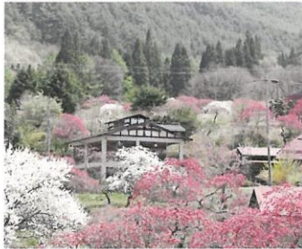
①ホドガイコース (0.3km) 山畑に咲く花桃を間近に見られます。