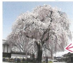
信廣寺のしだれ桜(4月中旬)