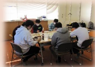
父親コースの様子