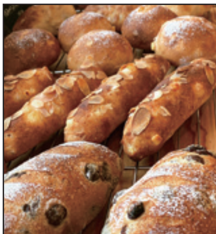
Bakery HITOMA 上田市大手2-2-27 26bldg 2F