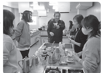
(ドリップ体験の様子)