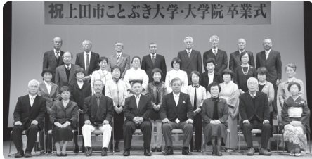
(中央公民館校卒業生)

3月8日(金)小春日和にも恵まれ、ことぶき大学中央公民館校 29名、城南公民館校 15名計 44名・大学院 11名が、卒業式を迎えました。今年度は、県歌『信濃の国』を斉唱、在校生の参加、来賓をお迎えして祝辞を述べていただいたりと徐々にではありますが、コロナ禍前の式にもどりつつあります。卒業生のみなさんは、この日の天気のように心晴れやかに卒業して、また新たな一歩を歩みだしました。