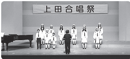
(上田市少年少女合唱団)

主に市内公民館を拠点として活動する合唱団体が日頃の活動の成果を披露する上田合唱祭を開催しました。今回は24の合唱団体、総勢約380人が参加しました。コロナ禍により自粛していた全員合唱を5年ぶりに行いました。全員合唱では一般の方を含め、会場にいる方全員で「花」を合唱し、皆さんの美しい歌声がホールに響き渡り、会場全体がハーモニーに包まれ、一体感あふれる素晴らしいものとなりました。