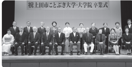
(城南公民館校卒業生)