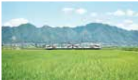
F 日本遺産ゆかりの地 塩田平