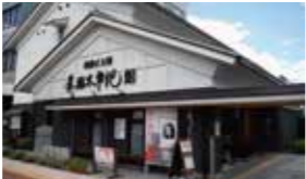
C 池波正太郎真田太平記館