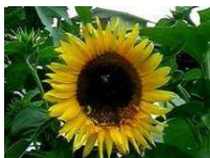
矮性ひまわり (通常品種もあります)