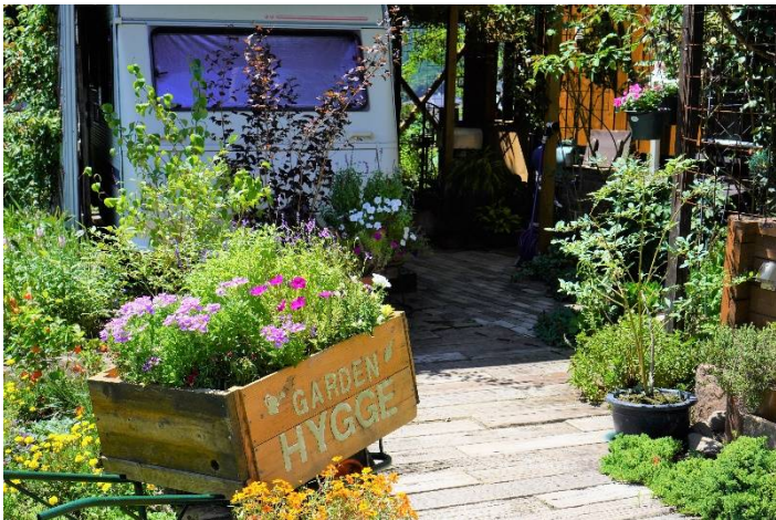
個人の部 安田邸（真田地域）