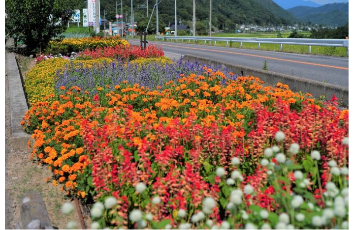
団体部門（50㎡以上の部） 荻窪花の会（丸子地域）