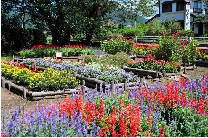
団体部門（50㎡未満・プランターの部） フラワークラブ大畑（真田地域）