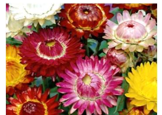
ヘリクリサム (貝殻草)