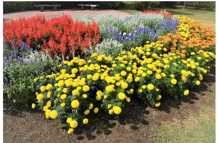
学校の部 丸子中学校