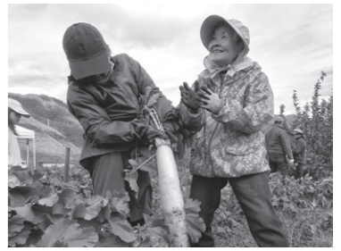
農業体験会の様子