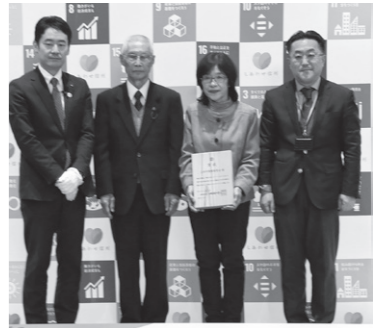
信州SDGsアワード2023 「信州SDGsアワード2023」受賞