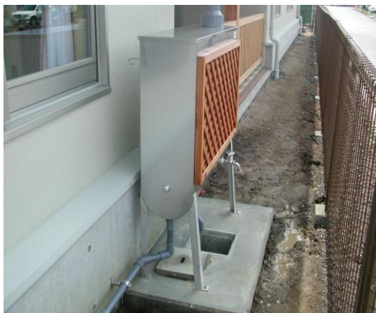
（市内の雨水貯留施設の設置例）

雨どいに接続した貯留タンク又は地下タンクに、建物から流れ落ちる雨水を一時的に貯めて、貯めた雨水を有効利用することができます。