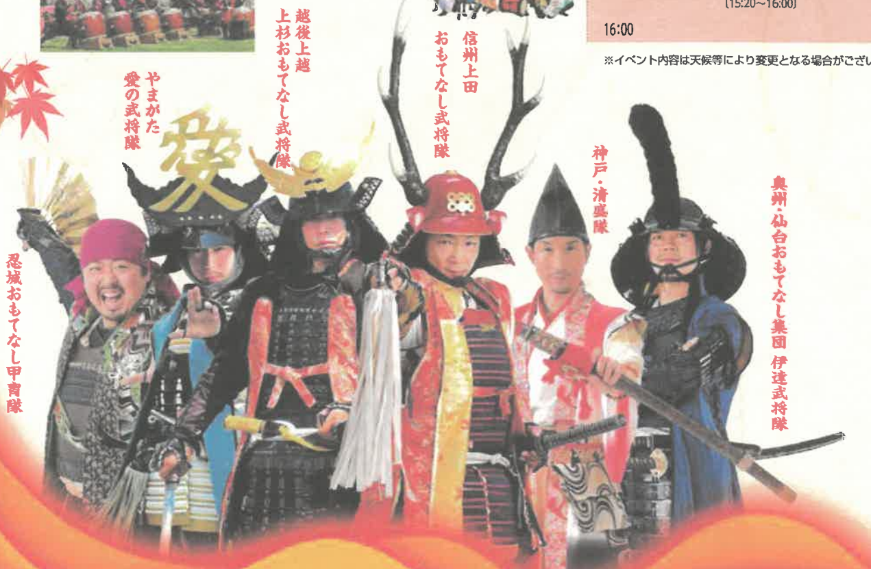
やまがた愛の武将隊 越後上越 上杉おもてなし武将隊 信州上田 おもてなし武将隊 神戸・清盛隊 奥州・仙台おもてなし集団 伊達武将隊