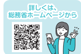
詳しくは、総務省ホームページから