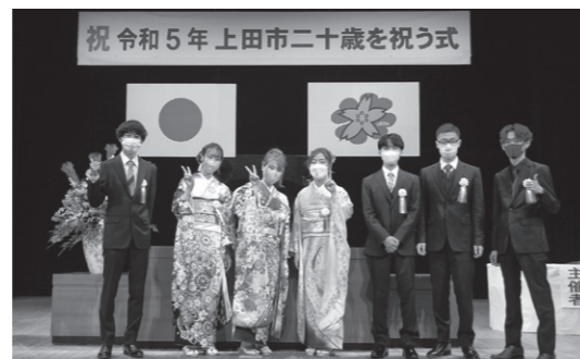
祝 令和5年上田市二十歳を祝う式