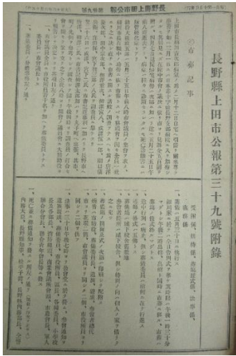
大正13年 細川市長市葬記事