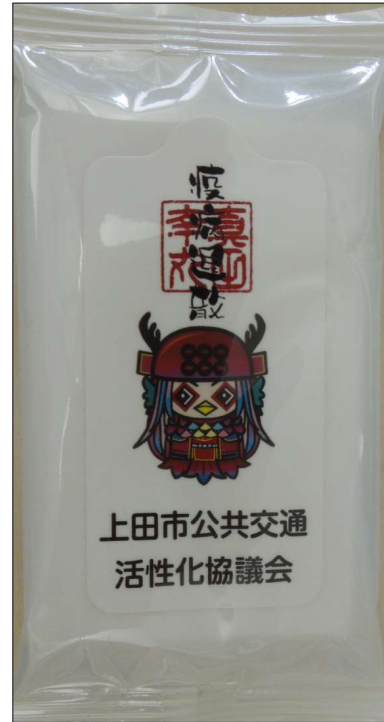
※ウェットティッシュ