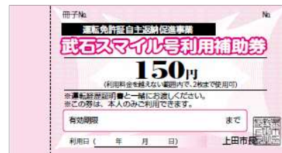
⑧ タクシー利用補助券