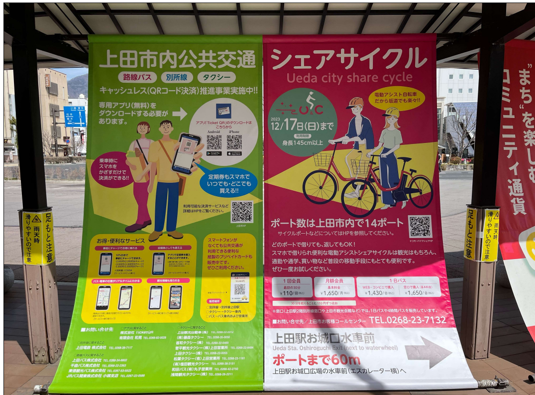
⑨ TicketQR・シェアサイクル利用促進タペストリー (上田駅)