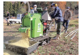
竹粉碎機の講習会