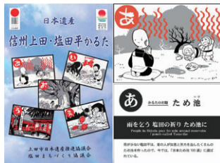
信州上田・塩田平かるた