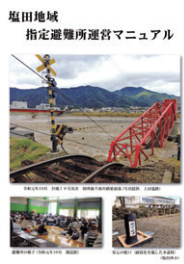
塩田地域指定避難所運営マニュアル