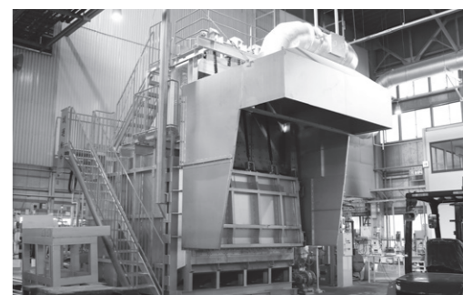
塩田工場に増設した溶解設備(6トン溶解炉)