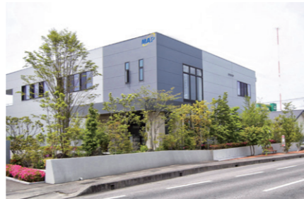
地域コミュニティと企業が共存する景観(古里)