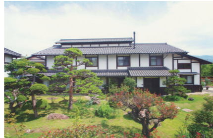
美しく蘇った蚕室造りの関邸(塩川)