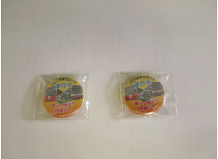
⑧運賃低減バス利用促進缶バッジ