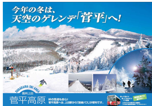
⑤冬季菅平高原線利用促進チラシ