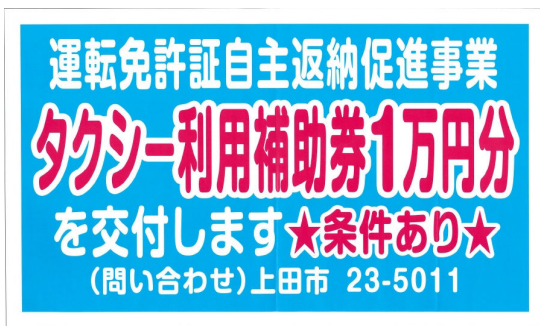
④運転免許証自主返納促進事業マグネットステッカー