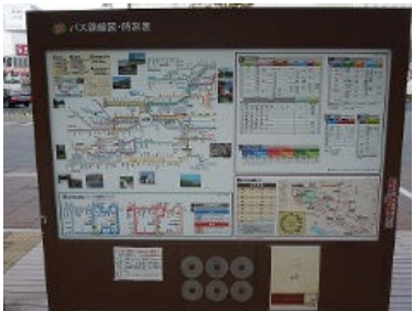
⑩上田駅前城口・大屋駅乗継情報掲示板