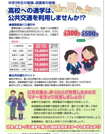
⑦中学3年生向け利用促進チラシ