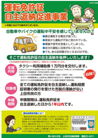
①運転免許証自主返納促進事業チラシ