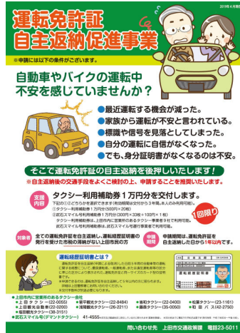
②運転免許証自主返納促進事業ポスター