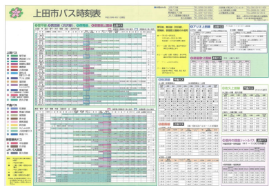
⑨上田市バス時刻表(10月・4月)