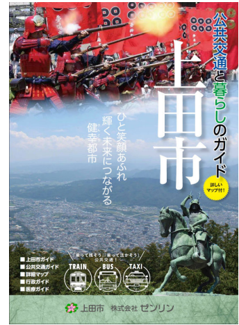
③上田市公共交通と暮らしのガイド