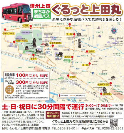
⑥フリーブック「楽天トラベルナビ」