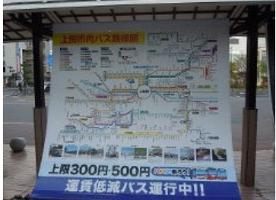
⑪バス利用促進タペストリー(上田駅前城口)