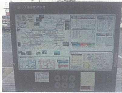
上田駅お城口乗継情報掲示板