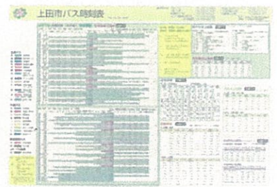
上田市バス時刻表(10月・4月)