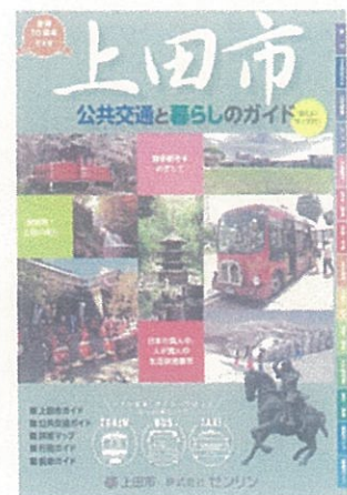
上田市公共交通と暮らしのガイド