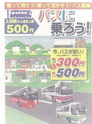
運賃低減バスPRチラシ (全戸配布)