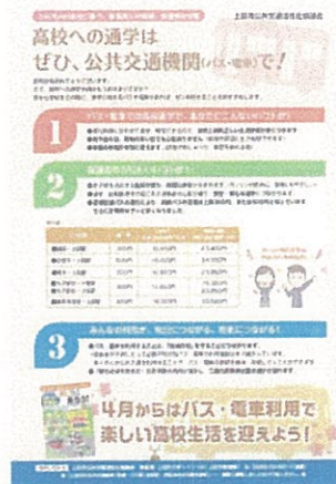
高等学校新入生向け 利用促進チラシ