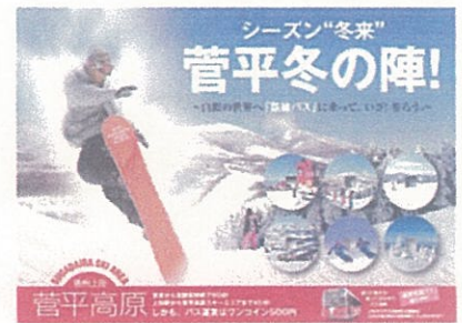
冬季菅平線利用促進チラシ