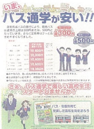
高等学校在校生向け 利用促進チラシ