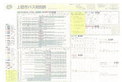
上田市バス時刻表(10月・4月)