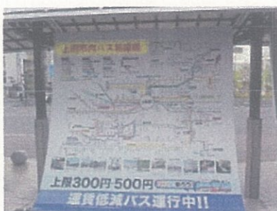
バス利用促進タペストリー (上田駅お城口)