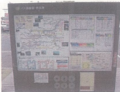
上田駅お城口乗継情報掲示板