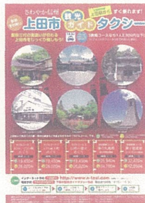
観光ガイドタクシー PRチラシ