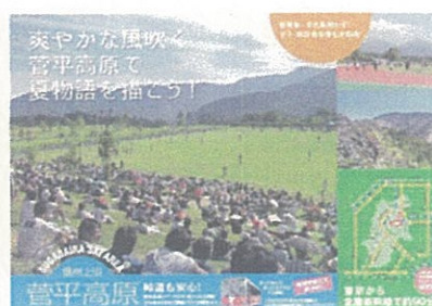
春夏季菅平線利用促進チラシ