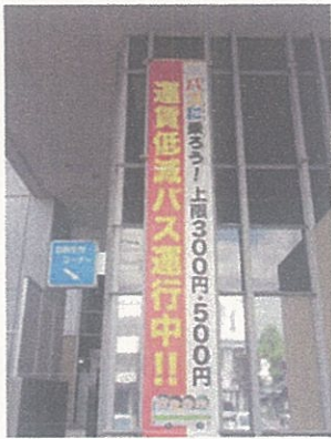
運賃低減バス懸垂幕 (市役所本庁舎入口)