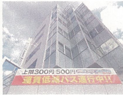
運賃低減バス横断幕 (上田駅前パレオ)