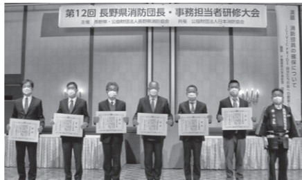
☎ 消防総務課 ☎26-0119

県の知事表彰基準を満たしたルート設計株式会社が「令和4年度長野県消防団協力事業所等知事表彰」を受賞されました。上田市消防団に積極的に協力し、地域への社会貢献を果たすため、市では「上田市消防団協力事業所表示制度」を設け、84事業所を認定しています。引き続き消防団活動にご協力いただける事業所を募集しています。