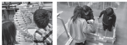
☎ 森林整備課 ☎23-5124

子どもの頃から木のぬくもりに親しんでもらうとともに森林資源の地産地消を図るため、長野県産木材で作られたおもちゃを市内の児童センター・児童クラブ10施設に設置しました。