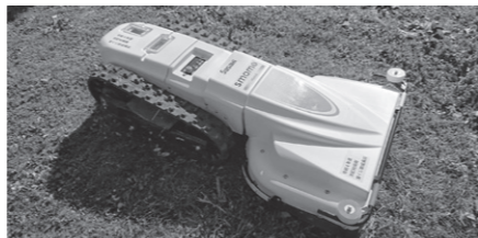
☎ 市民参加・協働推進課 ☎75-2230

新田自治会は、宝くじの社会貢献広報事業である(公財)長野県市町村振興協会の「地域活動助成事業」を活用し、電動式草刈り機を整備しました。