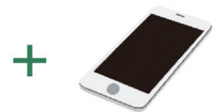
マイナンバーカード 読み取り対応の スマートフォン