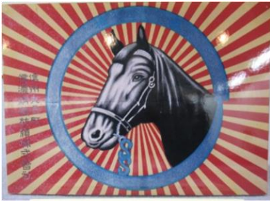
信濃絹糸紡績(株)商標「金馬頭」

この程、シナノケンシ(株)様から、同社の絹糸紡績資料館閉館に伴い、所蔵資料が上田市へ寄贈され、その一部が公文書館と丸子郷土博物館へ移管されました。