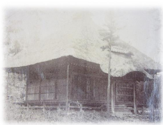
中禅寺薬師堂古写真

●この文書によると中禅寺の事由として「開基は旧記焼失に係り不詳。本村鉄城山に古寺屋敷の旧跡あり。弘仁・天長年間(平安時代初期)に空海上人が当寺に來遊し、雨乞い修業した遺跡あり。それ以来古義真言宗にして下野国足利の鶏足寺(けいそくじ)の末寺に属す」旨、記述されています。●