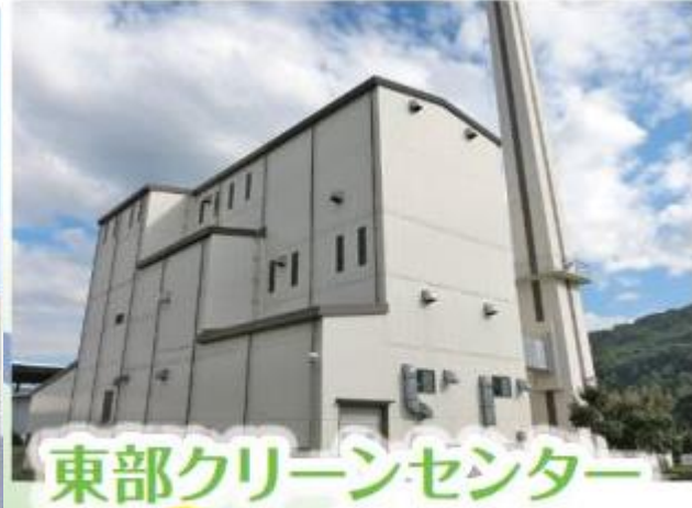
東部クリーンセンター