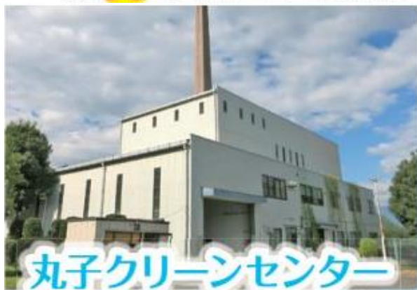
丸子クリーンセンター