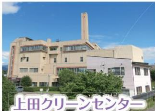
上田クリーンセンター

各设施老旧化比较严重, 设施安全运行管理的费用在年年增加。现实必须建设一资源循环型垃圾处理中心!!