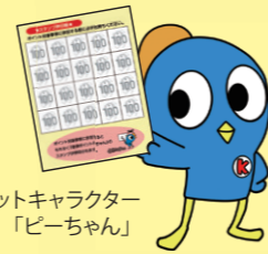
マスコットキャラクター「ピーちゃん」