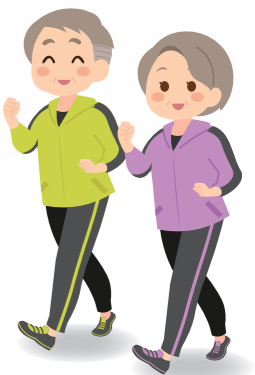
健康推進課 ☎ 28・7123