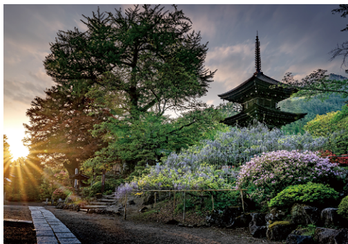
「前山寺の藤と山躑躅」 Yoshimasa Kakoさん