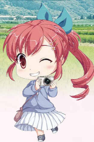
別所線存続支援キャラクター 北条まどか