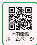
上田電鉄 ホームページ

上田電鉄別所線では、毎年春と秋の2回限定でお得なマイレールチケットを販売しています。今回は、通常のマイレールチケットよりもさらにお得な「マイレールチケットQR」(カード)も同時に販売しています。また、スマートフォン用QRコード決済アプリ「TicketQR」からもご購入いただけます。マイレールチケットをお買い求めいただき、お出かけの際は別所線をぜひご利用ください。