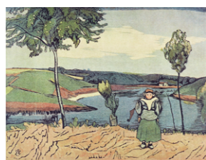
山本鼎《プルーターニュの入江》1917年