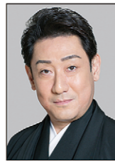
なかむら し かん 中村芝翫