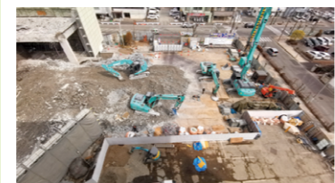
3月11日の市役所敷地内駐車場の様子

4月以降も旧庁舎の解体・改修や駐車場整備工事を行うため、市役所敷地内は駐車できません。誘導案内に従って駐車場をご利用ください。詳細は市ホームページなどでお知らせします。