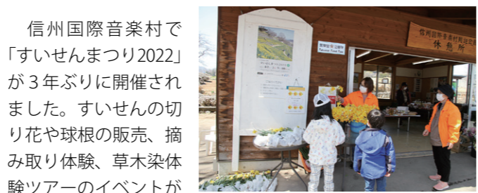
▲信州国際音楽村のすいせん (4月9日撮影)

信州国際音楽村で「すいせんまつり2022」が3年ぶりに開催されました。すいせんの切り花や球根の販売、摘み取り体験、草木染体験ツアーのイベントがあり、多くの来場者で賑わっていました。約10万本のすいせんが咲き誇る様は黄色いじゅうたんのように、多くの方が早春の風物詩を楽しんでいました。