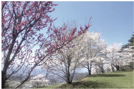
▲真田氏本城跡の桜 (4月17日撮影)

4月中旬には各地の桜が次々と花開きました。5月には、ツツジの名所としても名高い御屋敷公園で赤やピンク、オレンジなど、約600株のヤマツツジが咲き、圧巻の景色を楽しむことができます。