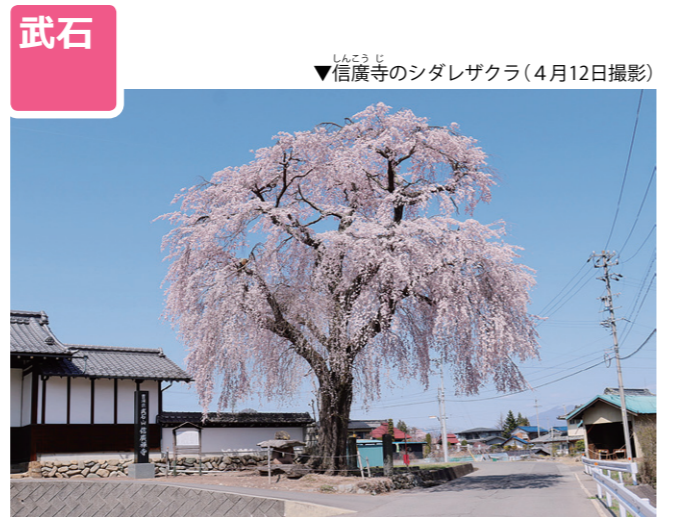
▼信廣寺のシダレザクラ (4月12日撮影)

暖かな陽気に誘われて武石の里も春の花を楽しめる季節になり、信廣寺ではシダレザクラが咲きました。これから見頃を迎える武石公園のヤマツツジや美ヶ原高原のレンゲツツジなど、武石の花を巡って楽しんでみませんか。