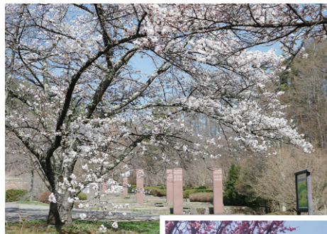
▲古城緑地広場の桜 (4月12日撮影)

信州国際音楽村で「すいせんまつり2022」が3年ぶりに開催されました。すいせんの切り花や球根の販売、摘み取り体験、草木染体験ツアーのイベントがあり、多くの来場者で賑わっていました。約10万本のすいせんが咲き誇る様は黄色いじゅうたんのように、多くの方が早春の風物詩を楽しんでいました。