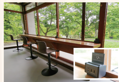
5 緑の中庭と桜が見えるカウンター席。USBケーブルが直接使える電源タップが便利!