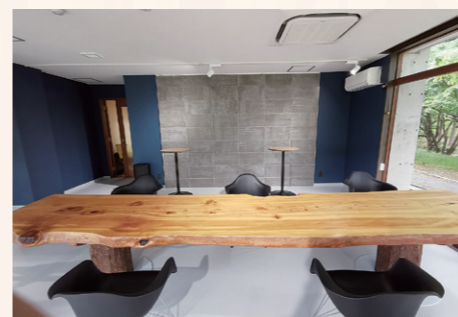
4 大木から切り出されたテーブル。スタンディング用テーブル(奥)でさまざまなワークスタイルにも対応!