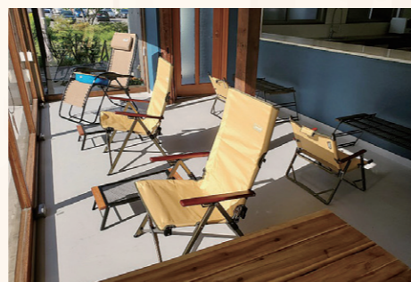
3 建物の雰囲気と周辺の自然に調和するようインテリアにアウトドアギアを採用！