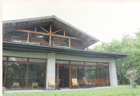
1 アウトドア感あふれる佇まい。 中庭でもWi-Fiが利用できます。

上田市技術研修センターは、上田リサーチパークが整備された際に、企業の方の研修施設として、平成9年に開設されました。施設内には、 会議室のほか、資格試験などの勉強用にも適している個室 もあります。この度、旧レストランエリアを開放的なコワーキングエリアに改修し、リラックスできる空間と集中できる空間の ハイブリット型テレワーク拠点 に生まれ変わりました。豊かな自然とロッジ風の佇まいが調和した絶好のロケーションもお楽しみください。