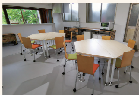
2 企画会議などに最適！ミニキッチンでは簡単な調理もできます。