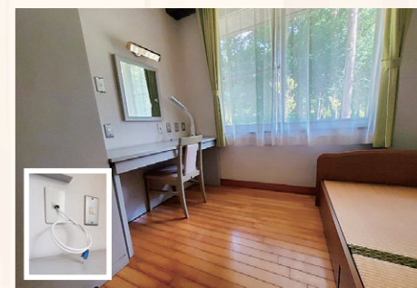
6 洋室(個室)にはワークデスクとベッド、クローゼットを配置。安定したネット接続用に有線接続もできます!