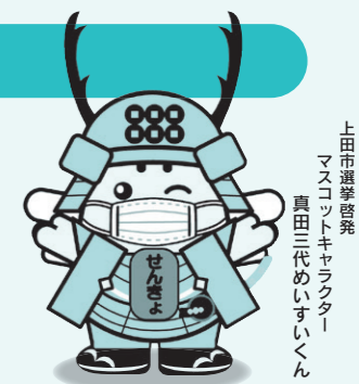
上田市選挙啓発 マスコットキャラクター 真田三代めいすいくん

※投票用紙に記載する筆記用具は持参したのものを使うこともできます(鉛筆またはシャープペンシルを推奨します)。