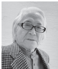
(子育て・子育て支援課)

☎ チャイルドラインうえだ事務局(平日10:00~15:00) ☎090-3565-7086 ☎25-2755 ✉ cl-ueda@bd.wakwak.com