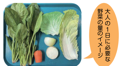
大人の1日に必要な野菜の量のイメージ