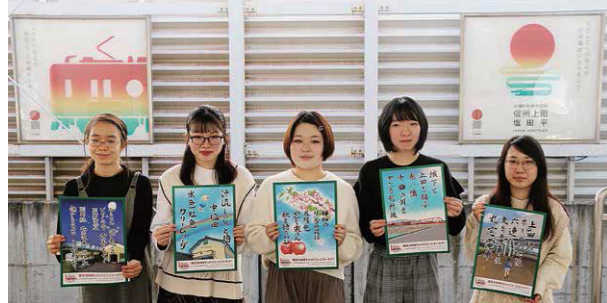
※「上田市活力あるまちづくり」支援金を活用しています。

上田女子短期大学の学生有志19人で活動している『うえだ乙女*』が、上田電鉄別所線開業100周年記念として上田電鉄に短歌ポスターを寄贈。学生たちが、別所線の15駅にちなんだ短歌を詠み、短歌に合う文字と絵を毛筆・スマートフォンで作成。ポスターは全車両内に掲示されています。学生たちは「別所線の魅力を多くの方に伝えられるといいな」と笑顔で話していました。