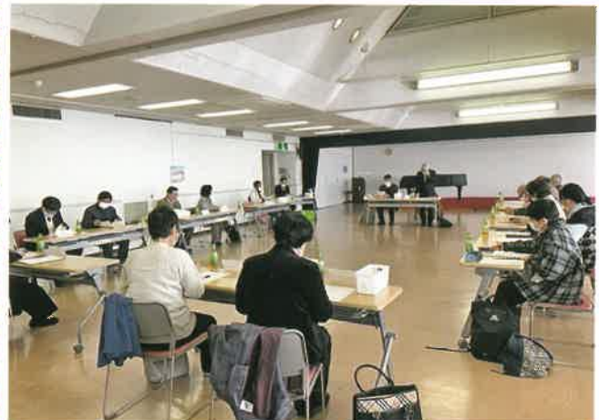
▲第一回作品審査全体会議 (中央公民館)

コロナ禍で授業日数が減った学校関係からも、昨年同様にたくさんの応募がありました。コロナに関連した作品の中には、大人の口ぐせになっている「早くコロナが終わればいいのにね」という願いが伝わってくるような作品もありました。選ばれた作品は、人権尊重への理解を深める啓発活動で活用させていただきます。例年以上に大変な状況の中、応募してくださった皆様に感謝申し上げます。(令和2年度人権作品応募総数 767点)