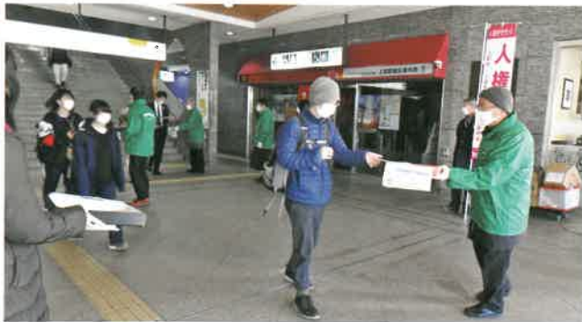
▲上田駅前での啓発活動

バス待ちをしていた高校生に、「人権について関心がありますか？」と尋ねると、「中学の時にハンセン病回復者の方からお話をお聞きしました。人権問題の深さを感じました。」と答えてくれました。人権への意識を持つ若者の言葉に、励まされた思いがした朝でした。