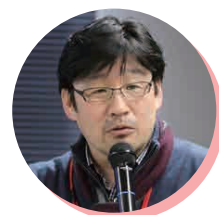
船木 成記氏 一般社団法人つながりのデザイン 代表理事(元長野県参与)