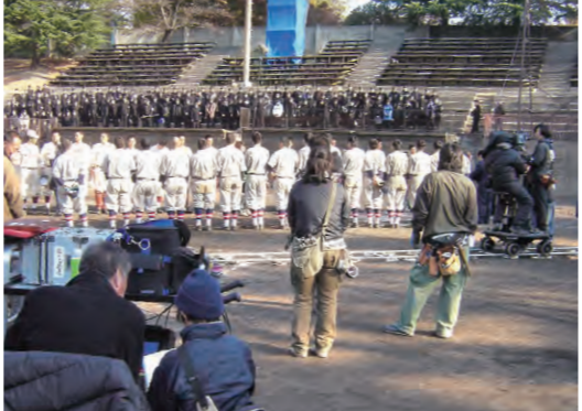
2008年『ラストゲーム 最後の早慶戦』 ロケ地：上田城跡公園野球場