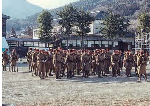
2003年『スパイ・ソルゲ』 ロケ地：浦里小学校