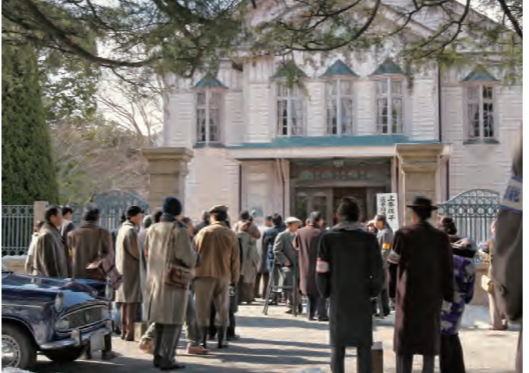
2009年『ゼロの焦点』 ロケ地：信州大学繊維学部