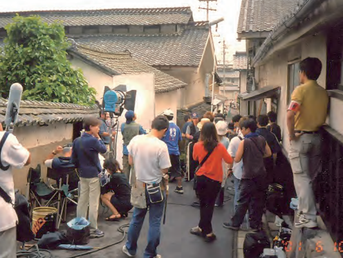
2002年『およう』 ロケ地：上塩尻地域