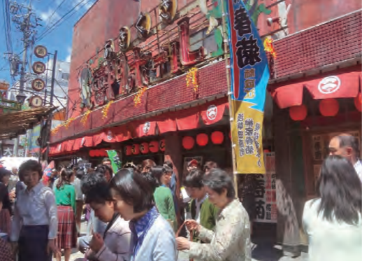
2014年『青天の霹靂』 ロケ地：上田映劇