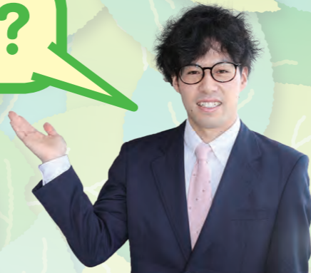
障がい者支援課 難波