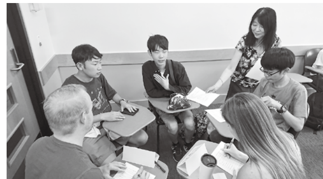
子どもたちの国際感覚を育む交流 「青少年派遣交流事業」(ブルームフィールド市郡)