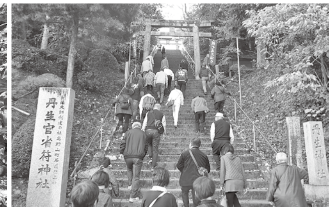
姉妹都市の魅力学ぶ市民ツアー 「市民交流団九度山町訪問事業」(九度山町)