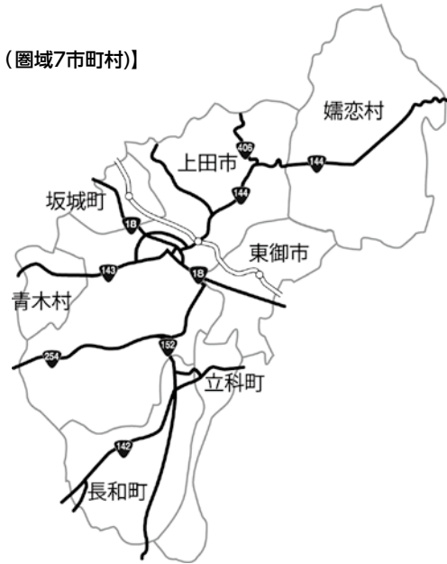
【上田地域定住自立圏（圏域7市町村）】