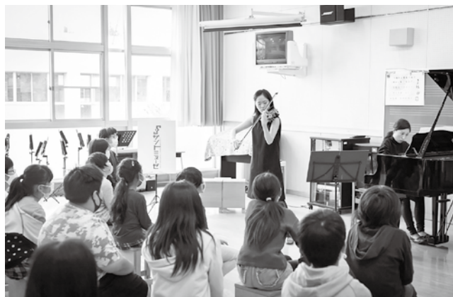
芸術家ふれあい事業「クラスコンサート」