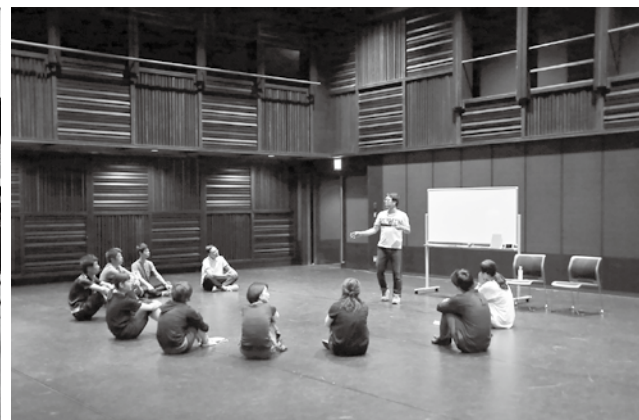
市民参加による「演劇事業」