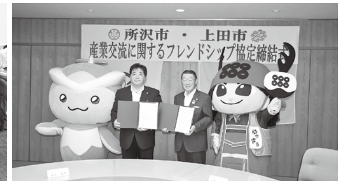
特色ある地域資源を活用した産業交流 「産業交流に関するフレンドシップ協定」(所沢市)