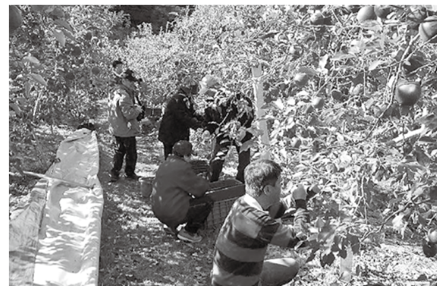
名産のりんごを生かしたシティプロモーション* 「東山観光農園りんごオーナー制度」(鎌倉市)