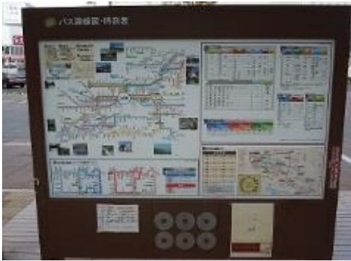
⑤ 上田駅お城口乗継情報掲示板