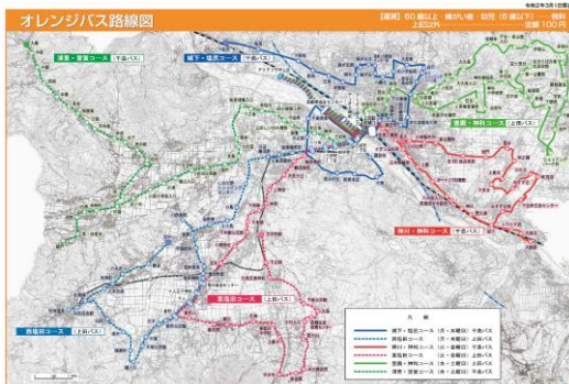
⑪ オレンジバス 路線図・時刻表