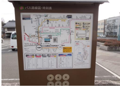
⑥ 大屋駅お城口乗継情報掲示板