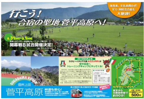
② 夏季菅平線利用促進チラシ