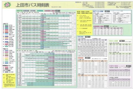
④ 上田市バス時刻表