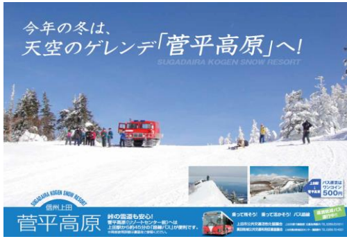
⑧ 冬季菅平線利用促進チラシ