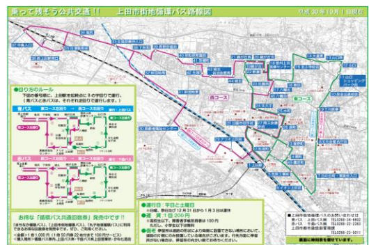
⑫ 上田市街地循環バス路線図・時刻表