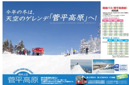
⑨ 冬季菅平線利用促進チラシ (東急バス車内掲示用)