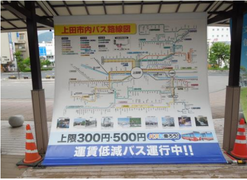
⑦ バス利用促進タペストリー（上田駅お城口）