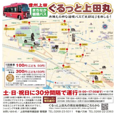
① フリーブック「楽天トラベルナビ」