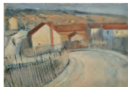
林悽衛《エスタック風景》1922年頃