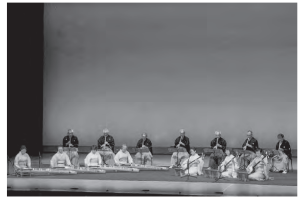
(☎ 交流文化スポーツ課)