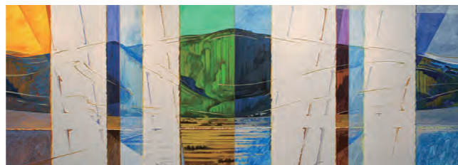
母袋俊也 (M436 TA-TARO 2) 2011年

長野県の戦後の現代美術史をたどるうえで重要な作家に焦点をあて、上田市出身の母袋俊也のほか、小山利枝子、辰野登恵子、戸谷成雄の作品を展示します。