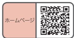
📍 生涯学習・文化財課