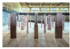
戸谷成雄 《双影景(ミニマルパロックIV)》 2008年

日時 ①1月29日(金) 18:00～20:00 (シンビズムとは) ②1月30日(土) 13:30～15:30 (長野登恵子・戸谷成雄作品について) ③1月31日(日) 13:30～15:30 (母袋俊也・小山利枝子作品について) 場所 まちなかキャンパスうえだほか 対象 高校生以上 定員 15名(応募多数時は抽選) 料金 無料 申し込み 1月9日(土)～15日(金)に、電話またはホームページの問合せフォームから。