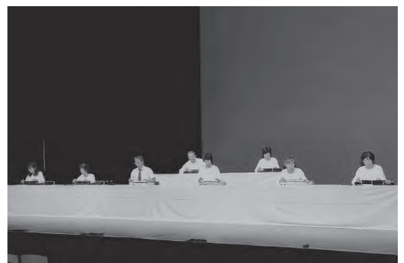
(☎ 交流文化スポーツ課)