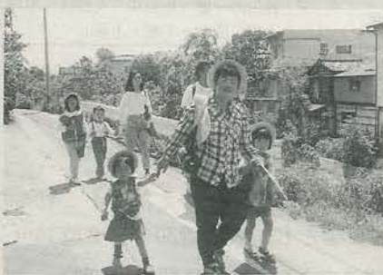
家族でウォークラリー (昨年)

「美しく老いるー生き生き健康づくり」をテーマに、今年も八月二十五日(日)、市民会館で、第十三回健康づくり市民のつどいを開催します。 今年は市民の皆さんから体験発表者を募集しますので、どうぞ応募ください。 △発表内容 わたしの健康法、わが家の健康づくり、寝たきり、痴ほうの介護体験など、四百字詰め原稿用紙八枚程度 △応募対象 本人およびその家族 △締め切り 六月二十九日(土) △問い合わせ 保健予防課(内線1376)