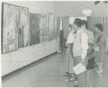
4月21日から同29日まで上田創造館で開かれた上小美術展