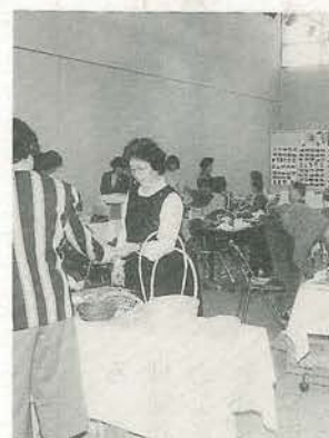
毎年盛況の消費生活展(昨年)