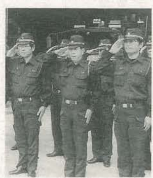
上田中央消防署で

十月二十一日(月)から十一月十六日(土)まで(ただし、第二・第四土曜日は閉庁日)に市役所三階総務課職員係(内線1203)へお申し込みください。