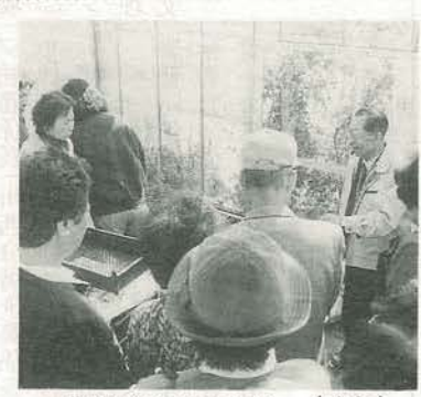
農業バイオセンター(昨年)

昼食後、市長および部長とのテーマ別懇談会を行いますので、皆さんのご意見をお聞かせください。▽解散 市役所前を三時ごろの予定