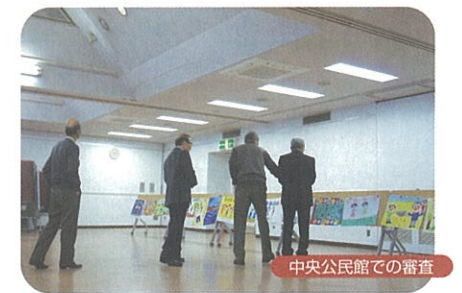
中央公民館での審査

人権尊重への理解を深めていただくために、人権に関わるポスター・作文・詩・標語を募集し、児童・生徒、一般市民の方から763点もの作品が集まりました。ご協力に感謝申し上げます。どの作品からも「つながり」を求め、共に生きていくことの大切さが伝わってきます。審査を経て応募作品の中より最優秀・優秀作品が決まりました。選出された作品は、一人ひとりの人権が尊重される社会の実現を目指し、今後の人権啓発活動で活用させていただきます。