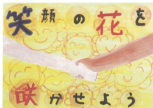
笑顔の花を咲かせよう 城下小学校五年 西村 咲月