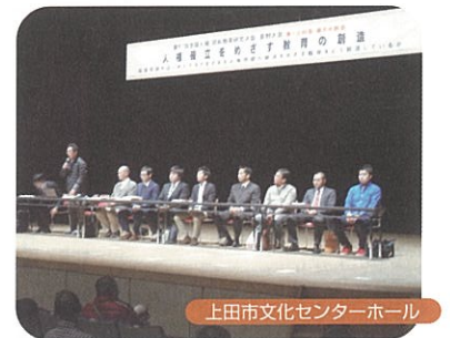
上田市文化センターホール

東日本では、東京に次ぎ30年ぶりに開催された研究大会に、全国各地から約1万人の方に県内にお越しいただきました。「差別の現実から深く学び、生活を高め、未来を保障する教育を確立しよう」をテーマに、全体会場の長野市ホワイトリングで基調提案等大会の意義を確認した後、各会場に分かれて、4の分科会・21の分散会を行いました。上田市では、学校教育に関係する分散会が行われ、会場に入りきらないほどの参加がありました。