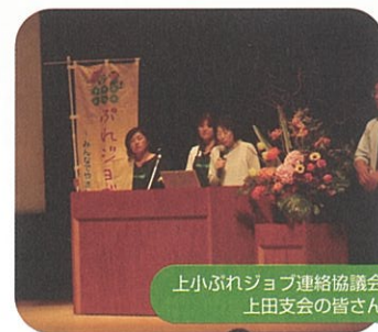
上小ふれジョブ連絡協議会 上田支会の皆さん