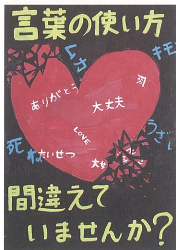
言葉の使い方 間違えていませんか? 川辺小学校 六年 高原 万桜