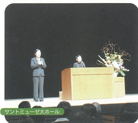
サントミュージアム大ホール

華やかなイメージの方と想像していましたが、大変な苦勞と経験があつて今日があることを学び、参加した多くの方が温かな気持ちで帰ることができたと思います。