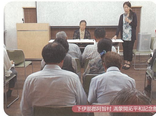
下伊那郡阿智村 満蒙開拓平和記念館