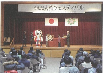
うえだ人権フェスティバルで表彰式が 行われました。(平成28年2月20日)

今年度も小中学生をはじめたくさんの方に、応募していただきました。 その中から最優秀作品に選ばれた作品の一部を紹介します。